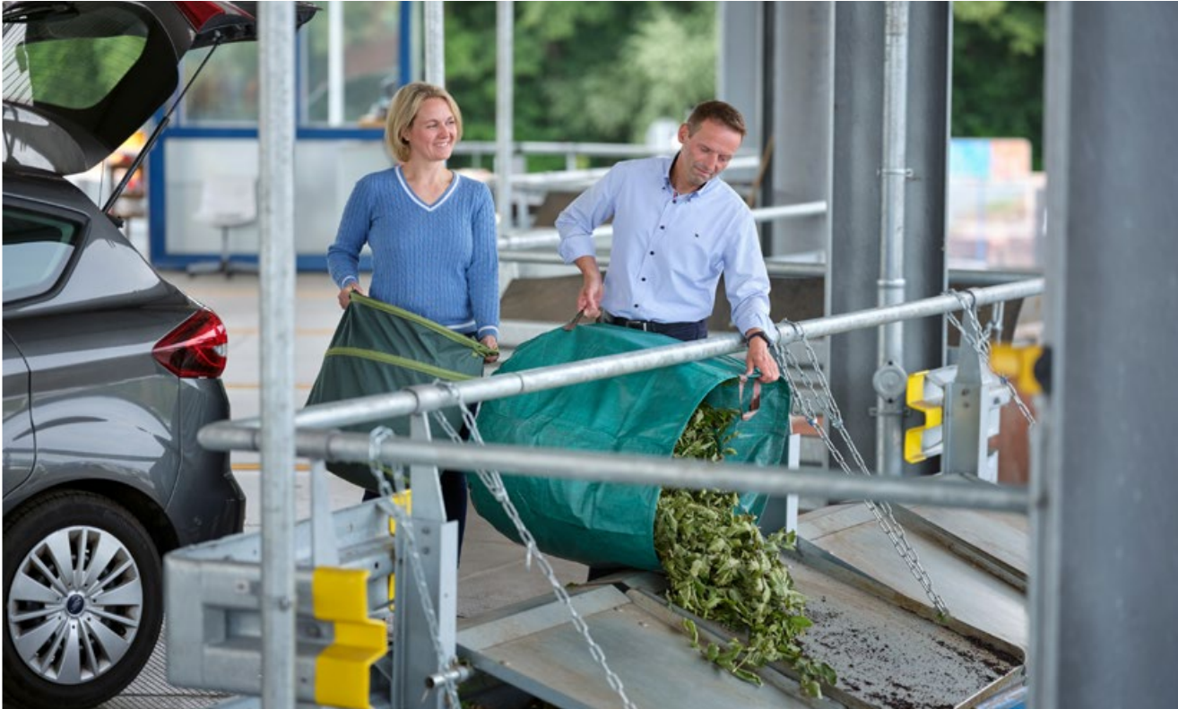
Abbildung 2: Anordnung der Rutschen zum einfachen Handling von Grünabfällen