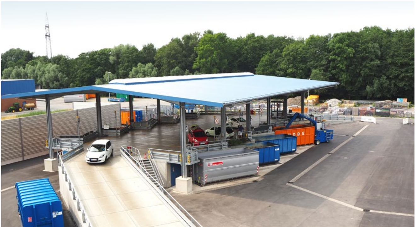
Abbildung 1: Modulo-Rampenanlage mit Überdachung